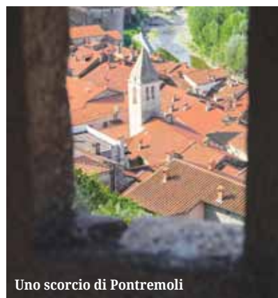
Uno scorcio di Pontremoli

L'appuntamento per la manifestazione organizzata dalla Fondazione Città del Libro è per il 21 maggio. Lo storico premio letterario è riservato ad un libro di narrativa per ragazzi e ha le proprie origini nella prima Giornata dei ragazzi nella Città dei librai che si tenne a Pontremoli il 17 agosto 1957 in occasione della proclamazione del vincitore del Bancarella di quell'anno. All'autore vincitore viene consegnata la ceramica "San Giovanni di Dio, Protettore speciale dei Librai" il simbolo dei Premi Bancarella.