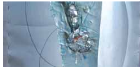
Il dettaglio di alcune opere di Adriano Alunni