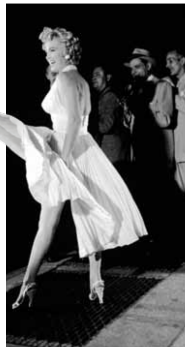
Marilyn Monroe stands above a subway grating in the famous scene from "The Seven Year Itch". New York City, USA, 1955

bruciata" di Nicholas Ray, "Moby Dick" di John Huston, "Il processo" di Orson Welles, "Il pianeta delle scimmie" di Franklin J. Schaffner, "Zabriskie Point" di Michelangelo Antonioni e numerosi altri. La mostra mette inoltre in luce lo stretto rapporto tra Magnum e il mondo del cinema, iniziato con Robert Capa: le sue amicizie avevano permesso a lui e a molti altri fotografi dell'agenzia l'accesso all'universo affascinante di Hollywood. Una relazione che prosegue da circa settant'anni e che ha portato a includere film e star di tutto il mondo. Orario: dal martedì alla domenica ore 10-19, chiuso il lunedì.